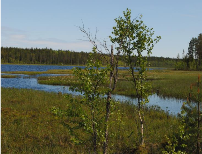
En bild som visar Sågträsket en solig och vacker sommardag

Namnet Sågträsket har hos några av oss väckt en fråga: varför Såg? Har det funnits en såg där? I så fall hur långt tillbaka i tiden är det?