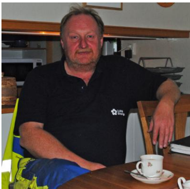
En bild tagen av Tomas Nilsson, ansvarig för ombyggnaden av nätet i Måttsund

Inför beslut om en ombyggnad var det en önskan och ett krav från Lunet att de dels skulle få behålla alla sina 120 kunder i Måttsund men också att de skulle få 30 nya, dvs. 150 kunder. Resultatet blev näst intill lysande, Lunet förlorade visserligen några kunder men fick många nya. Idag är 178 kunder anslutna i nätet.