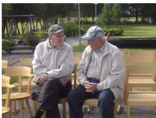
Här löser man världsproblem.