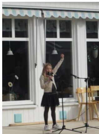
...och här har vi en av dem