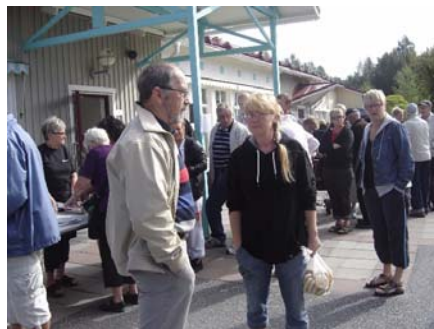
Kommersen i full gång