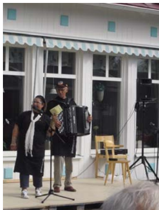
På jakt efter småstjärnorna.....