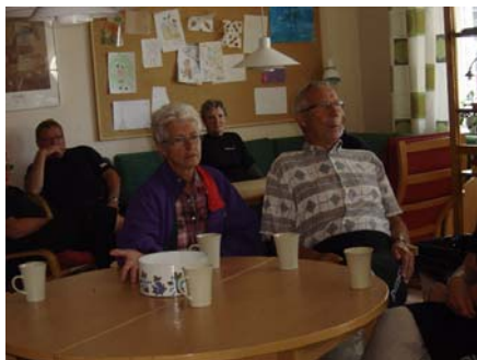
En stärkande kaffetår innan start...

Här möts man och här trivs man årligen i augusti! Härliga bilder att skåda i vintermörkret.