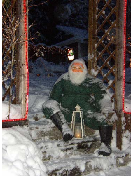
Tomten på Långbackavägen.