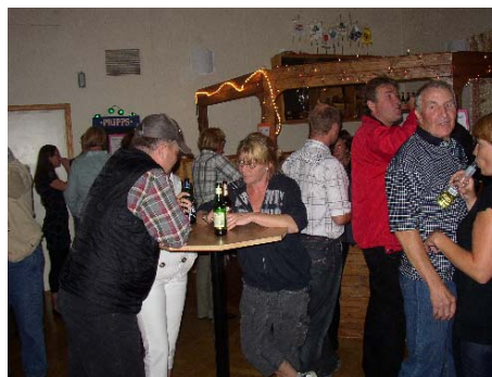
I Medborgarhuset kunde man antingen ta sig en svängom på dansgolvet eller besöka baren

Intresseföreningen och arrangörer för dagen ser gärna en utveckling där Måttsunds dagen också blir en hemvändardag för alla som har flyttat från byn genom åren. Det är många ungdomar som har växt upp i Måttsund och flyttat hemifrån och från byn för att studera eller för jobb på annan ort. Det