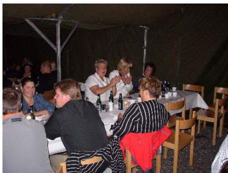
Efter avslutad festmiddag så sjöngs det allsång där stämningen var mycket hög