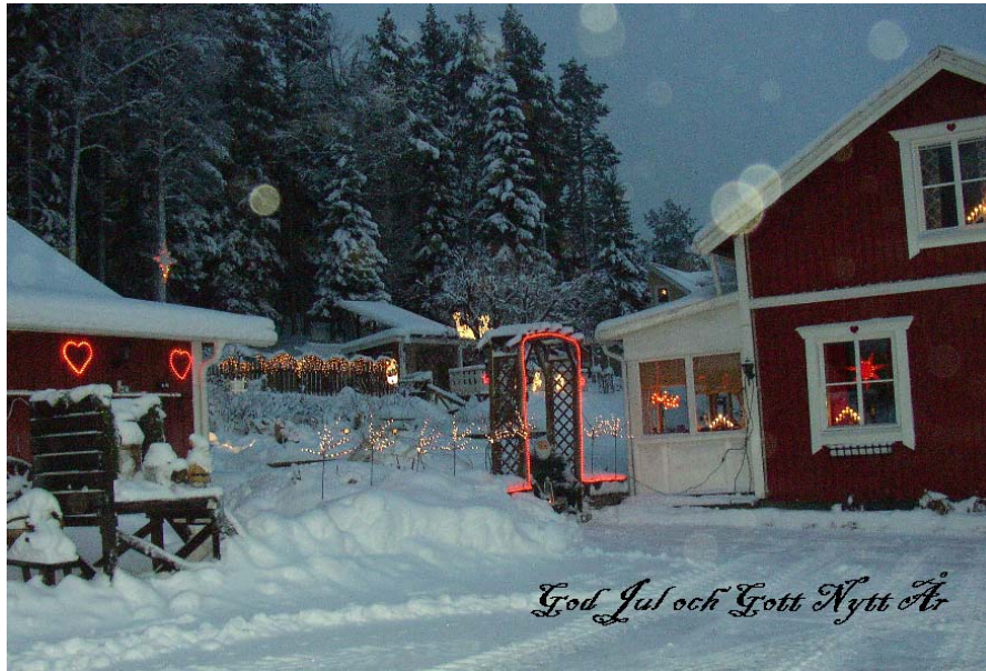
Bild tagen en sen kväll hos Bo och Majvor Bäckström på Långbackavägen.