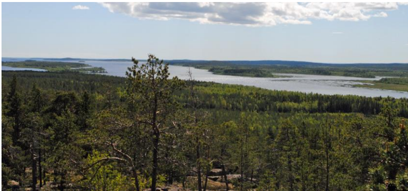
En bild tagen från Öberget med vacker utsikt

Det finns en möjlighet att en del av Öberget kan komma att användas för utvinning av grus. Ett lokalt företag har ansökt om tillstånd för täkt på baksidan av berget; den del som vetter i västlig riktning mot Antnäsaviken. Miljöprövning pågår nu, och det är troligt att ett beslut om tåkten tas under det här året. Utfallet är intressant, då intresset av en god naturmiljö får balanseras mot den nytta som alltid kommer samhället till del vid ekonomisk verksamhet. Om utvinningen av grus kommer till stånd, så är det inte första gången som Öberget kommer att ge arbetstillfällen och skatteintäkter till kommunen. Tvärtom; Öberget har en lång historia av mineralutvinning.