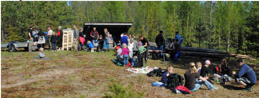
En bild tagen på fäbodvallen i Bäckmellanbodarna

IK Örnen och Intresseföreningen ordnade med en gemensam utflykt till Bäckmellanbodarna söndagen den 5 juni, en dag då vädrets makter stod för ett soligt och vackert väder.