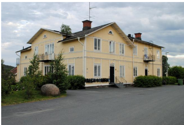
En bild på Länets första sanatorium

I Sandträsk 4 mil norr om Boden fanns en jordegendom med en ståtlig herrgårdsbyggnad ägd av överste Carl Otto Bergman . Som mest fanns där 80 fjällkor och 14 hästar. Efter Bergmans död köpte Norrbottens landsting egendomen 1908 för att använda den som sanatorium. Detta öppnades 1913. Det blev senare om- och utbyggt och återinvigdes i september 1931. Som mest fanns här trehundra vårdplatser. Sanatoriet var i bruk till 1964. Vid den tiden hade man i det närmaste utrotat sjukdomen. Den viktigaste åtgärden för att nå detta resultat vanns med hjälp av Calmettvaccinering som påbörjades 1940 samt medicinen PAS.